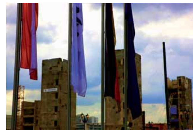
« Berlin/Beyrouth the walls 2 » • 2009/1998 • Dyptique 80 x 120 cm Argentine Papier fuji flex metal sous diasec

En 2005 est promu Chevalier des Arts et des Lettres.