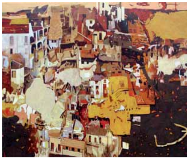
« Séisme n°4 » • 2010 • 54 x 65 cm • Acrylique sur toile

Floriane travaille principalement avec des galeries d'art (Galerie Paris-Beijing) mais aussi en publicité (agence Laurence Boué, Paris) et pour la presse internationale.