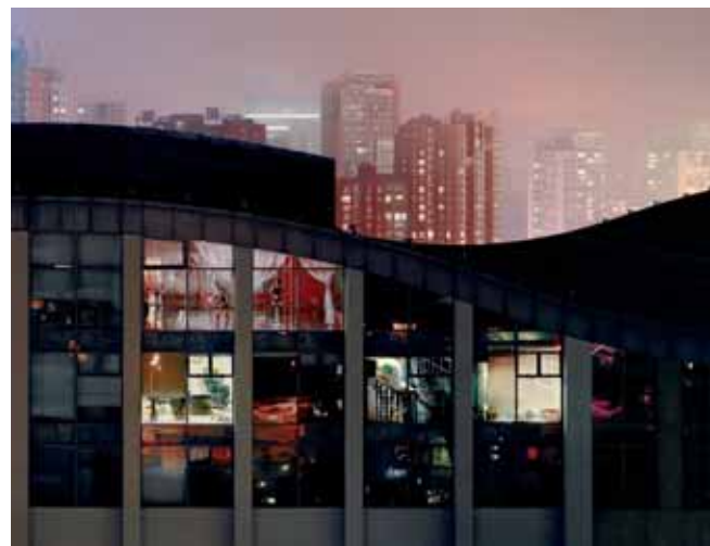
« Pékin 214 » • 2009 • 120 x 150 cm • Tirage Lambda sur papier Kodak Metal, encadré en caisse américaine avec verre anti-reflet

Ancien étudiant des Beaux-arts de Paris, il est établi aujourd'hui dans son atelier, et travaille chez lui.