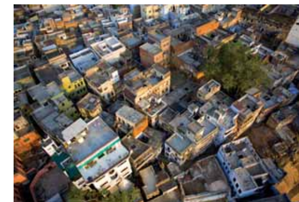
« Varanasi rooftops » • 2006 • 60 x 90 cm • Photo aérienne par cerf-volant

Les lignes fuient, l'image se volatilise, la forme se perd, et entre les lignes, l'imaginaire se crée.