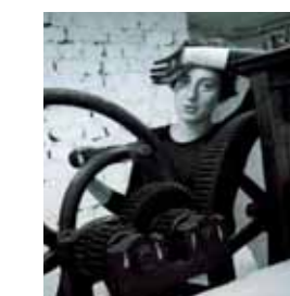
« Couverture de façade » • 2008 • 160 x 120 cm Xylogravure-Bois perdu en 3 couleurs

Il vit maintenant en Inde avec sa famille, et pratique plus que jamais son activité.