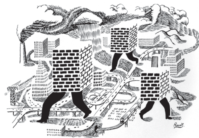
« sans titre » • 2011 • 70 x 100 cm • encre sur papier

Nous retrouvons ici des préoccupations qui parcourent, depuis plus de vingt ans, l'œuvre d'Hervé Roche. Convaincu que la rencontre entre le monde naturel et le monde humain se joue, aujourd'hui plus que jamais, sur un mode conflictuel, il invente une géographie urbaine naturelle du hasard. Ses toiles témoignent de la domination des forces terrestres. Les éléments y morcellent la ville et la condamnent à renaître de cette multiplicité fragmentaire dans une nouvelle unité, une nouvelle dynamique. La ville change de visage, devient environnement à son tour et apprend peut-être, dans ce renouvellement esthétique, à porter en elle la menace éternelle des entrailles de la terre.