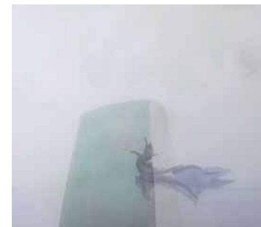
« A lizard spitted and spitted through the mouth » • 2010 • 190 x 220 cm Transfert photographique, acrylique, huile, vernis

Inspirée par mes voyages au cours de ces dix dernières années, j'ai assisté à la reconstruction de Beyrouth (Solidère) juste à côté des quartiers bombardés dans lesquels la vie était maintenue. Parallèlement, j'ai pu photographier la destruction des murs des immeubles de la Stasi dans un Berlin résolument moderne et artistique. Les photos seront présentées en dyptique et triptyque pour bien ressentir la différence d'intensité lumineuse des deux villes et le combat si différents qui quelque part les rapproche, Les murs s'effondrent et se reconstruisent pour des raisons majeures sur fond de guerre ou de changement de régime politique.