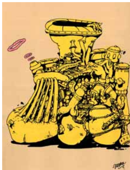
« piano loco » • 70 x 50 cm • acrylique sur papier